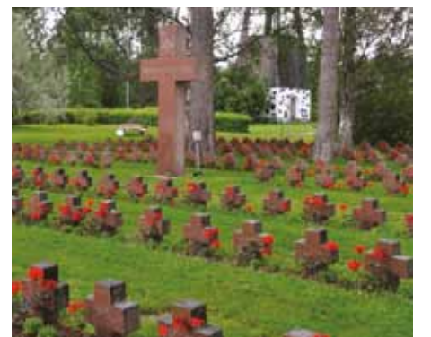
Suomussalmen sankarihautausmaa.