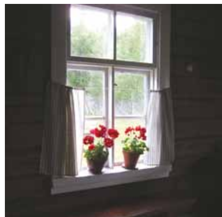
"Mummon akkuna". Kuvaajana R.R. Kajaanista