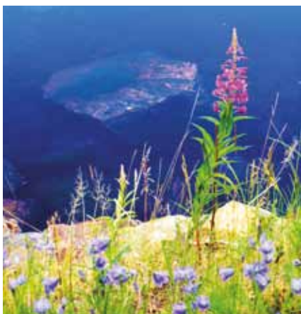
Paltaniemi, Oulunjärvi. Kuvaajana Arttu Vihko

Facebook-linkki kilpailukuviin www.facebook.com/kainuu