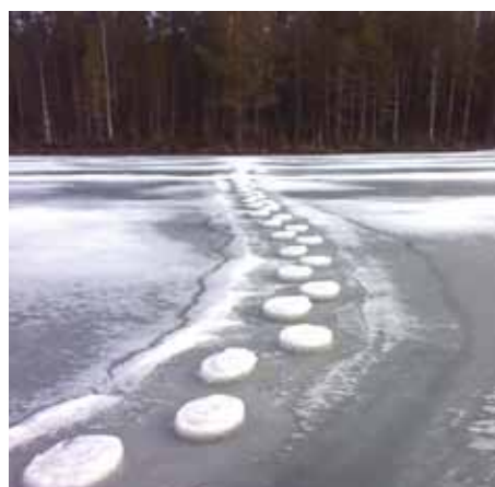
"Taival lie hankala-olkoon vaan", Lentiiran Jysmänselkä.