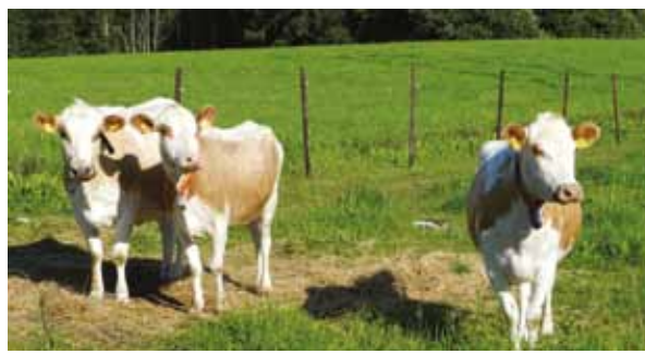
Rinnallakulkijat, alkuperäisvoimaa Kainuusta. Seppälän koulutilan kyytöt Elotar, Aru ja Ammuli.