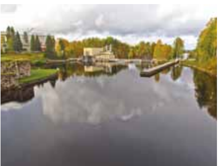
"Kolmea -aikakautta".