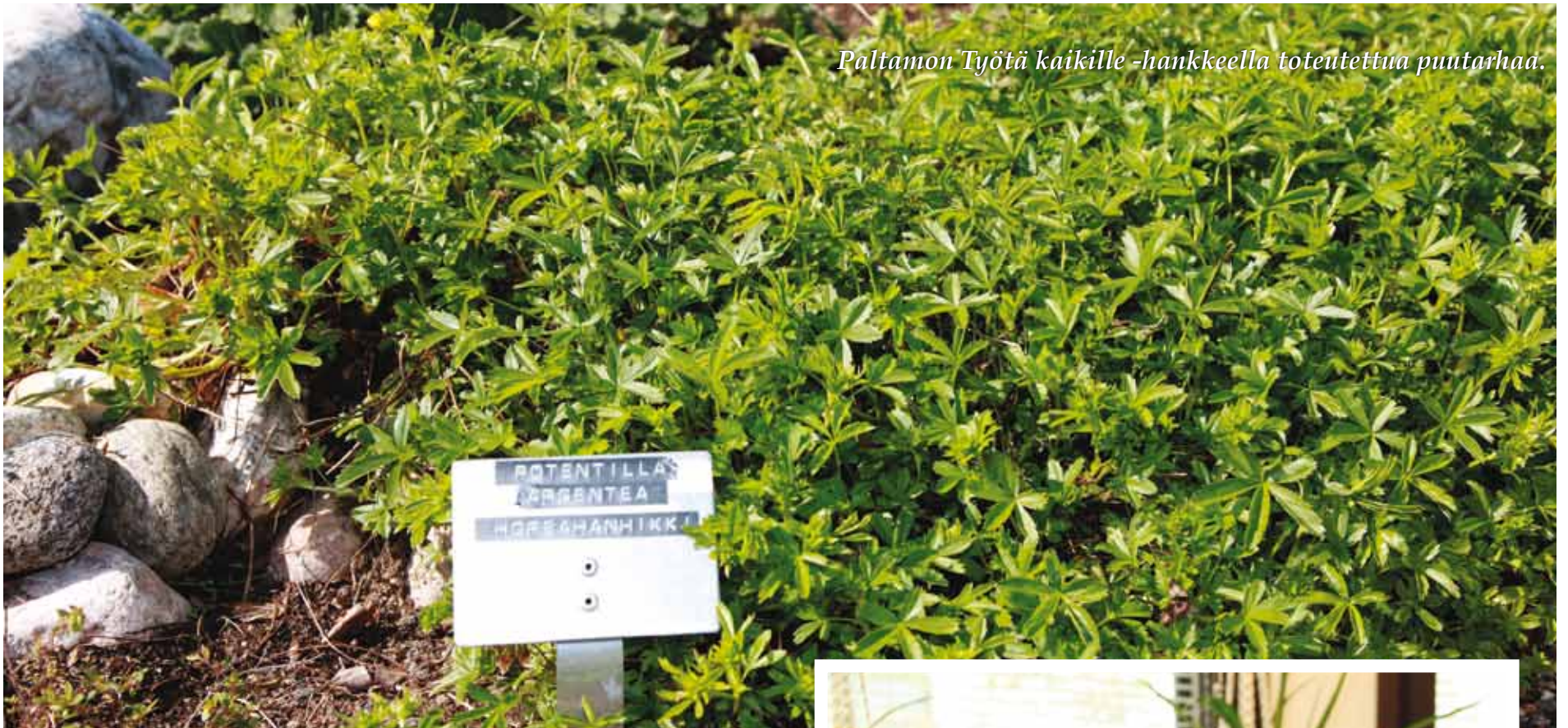
Paltamon Työtä kaikille -hankkeella toteutettua puutarhaa.