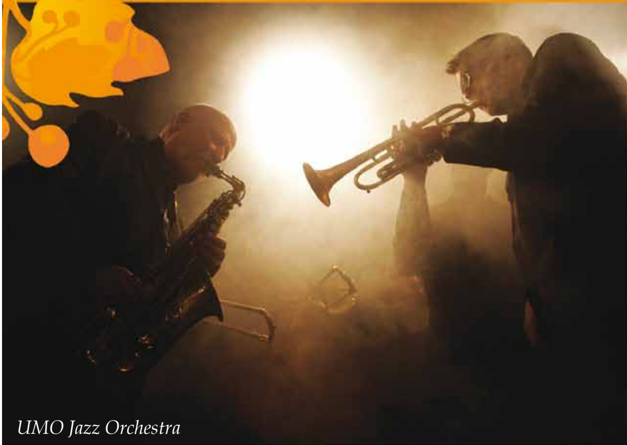
UMO Jazz Orchestra

Tervetuloa juhlimaan ja nauttimaan helsinkiläisten kainuulaisille järjestämistä tapahtumista!