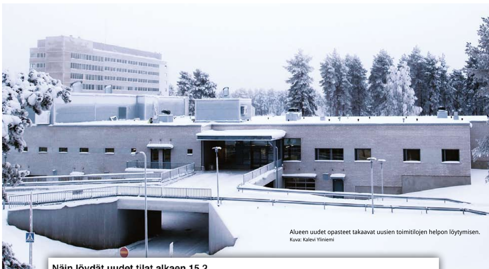
Alueen uudet opasteet takaavat uusien toimitilojen helpon löytymisen.