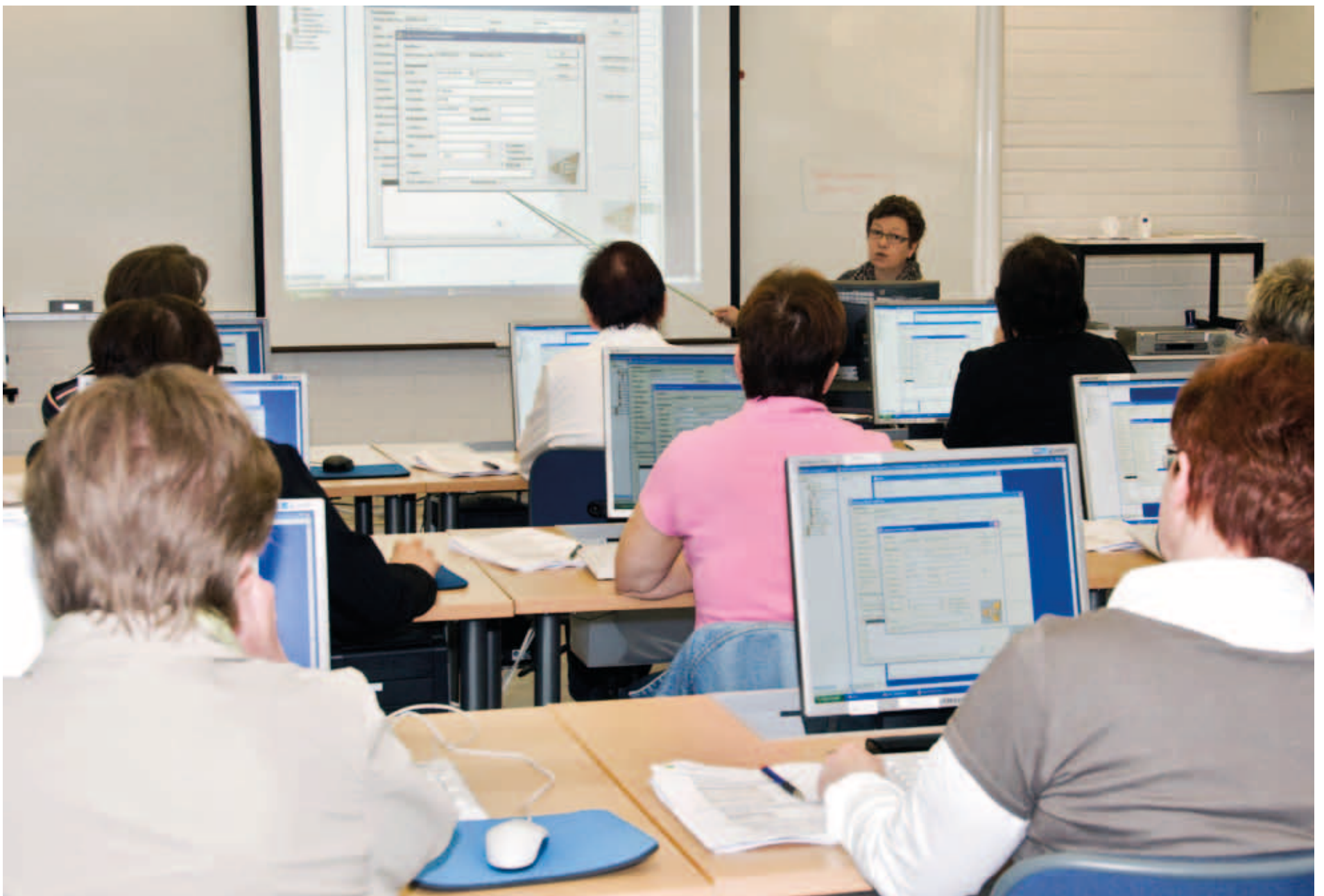
Kainuulaisia terveydenhuollon ammattilaisia koulutetaan uuden Effica -potilastietojärjestelmän käyttöön.